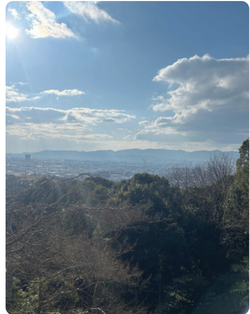
京都の伏見稲荷を散策した際に撮影した写真です。

私が看護師を目指したのは小学生のころ家族が入院していた病院の看護師に憧れたことがきっかけでした。まだ幼く病院という場所がとても恐ろしいものだと考えていた私は、優しく声をかけてくれた看護師さんに憧れ、自分もそんな関わりをしたいと思い、看護師を志しました。憧れの看護師に追いつけるよう、日々奮闘中です。そんなせわしない毎日ですが、おいしい食べ物を食べたり、旅行に行ったりと息抜きをしなかり過ごしています。これからは適度に息抜きをしなかり看護に向き合っていきたいです。