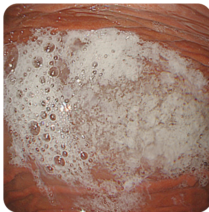
唾液がたまっている状態

写真①検査前に飲み込んだものは当然胃の中にいます。この状態で何か異常を探してくれと言われても不可能なので、胃カメラで吸って洗ってから検査が始まります。この洗浄する時間は減らしたい。「早く終わりたいなら飲み込まない！」これが鉄則です。