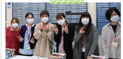
受付案内スタッフ