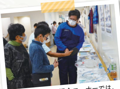
看護師のお仕事紹介コーナーでは、たくさんの子供たちが足を止めて手術器具などを手に取っていました。