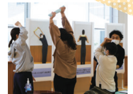
肩こり体操体験中