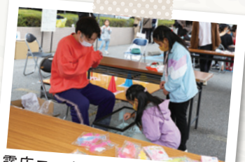
露店コーナーではたくさんのお子さんが楽しんでいました