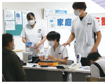
家庭用自動血圧計点検ブースに持ち込みされた血圧計を臨床工学技士が点検しました