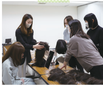
ウィッグ相談や体験コーナーの様子