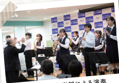
高瀬中学吹奏楽部による演奏